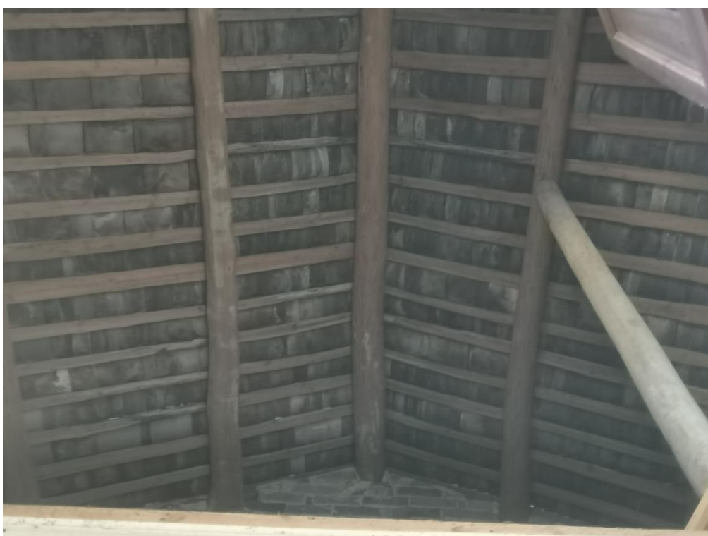
图 8 屋面构造