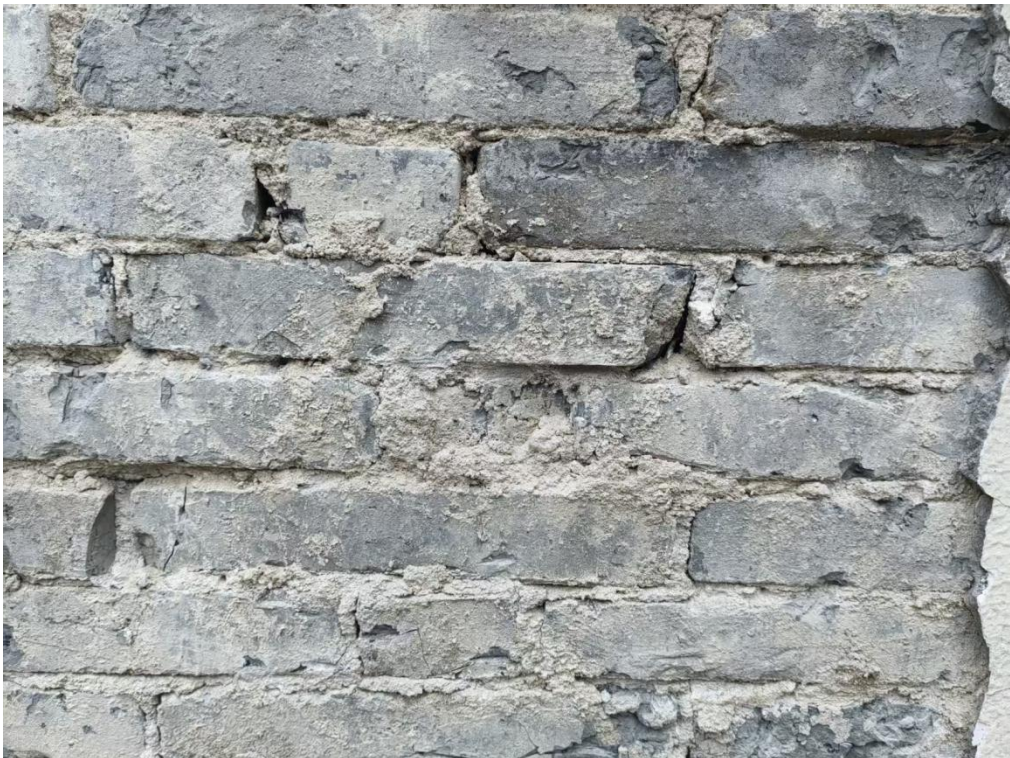
图 6 局部测区