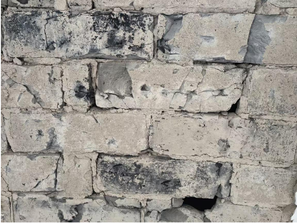
图 5 局部测区