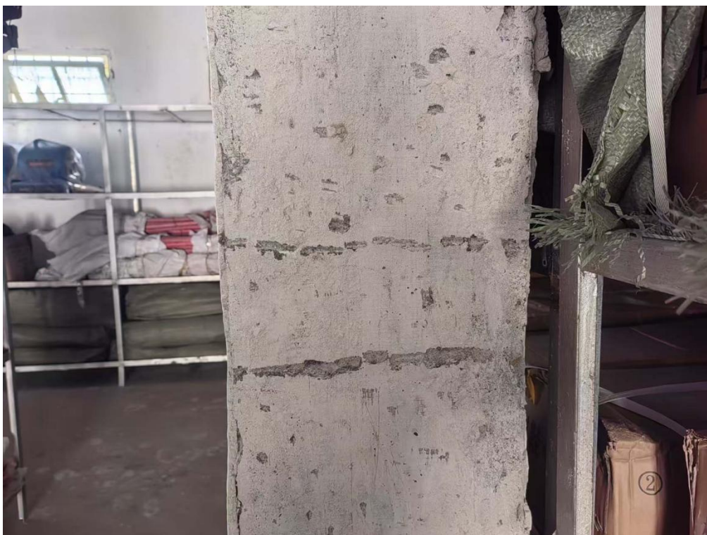
图 7 局部测区