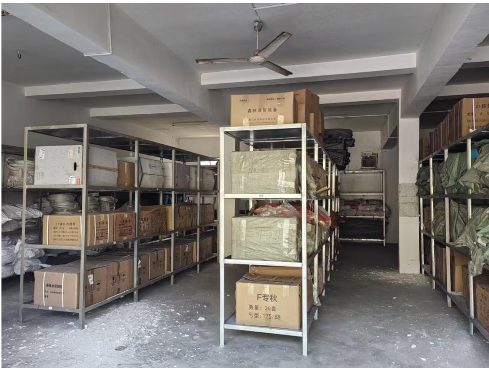
图 4 内部构造