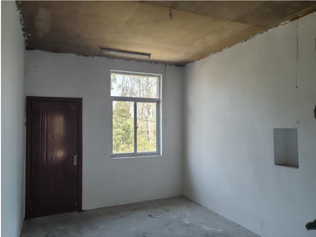
图 3 内部构造